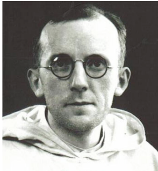
El Padre Calmel